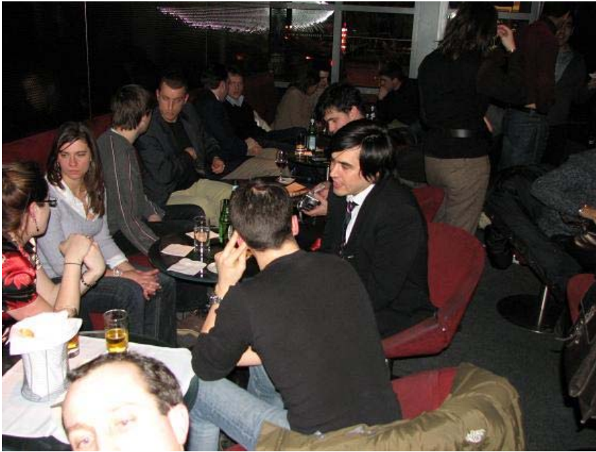
Images de l'after-Yulbiz